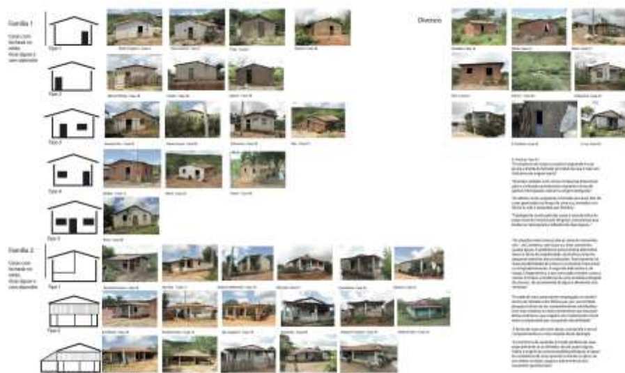
Imagem 3: Primeira identificação de padrões construtivos.

Com tais levantamentos e dados acumulados, já foi possível iniciar um processo de identificação de padrões, levantando-se a hipótese da existência de duas famílias de casas: uma com duas águas e entrada na fachada do oitão. Esta divide-se em cinco diferentes tipos, identificados pela posição das portas e janelas: porta à esquerda, à direita, janela à esquerda, à direita e porta no meio com duas janelas, uma em cada lado. A outra família de casas também são casas de duas águas com entrada na fachada do oitão, porém com o aparecimento de um alpendre. Esta família de casas subdivide-se em três tipos: com a varanda ocupando metade da fachada principal, varanda ocupando a fachada inteira ou varanda em “L”.