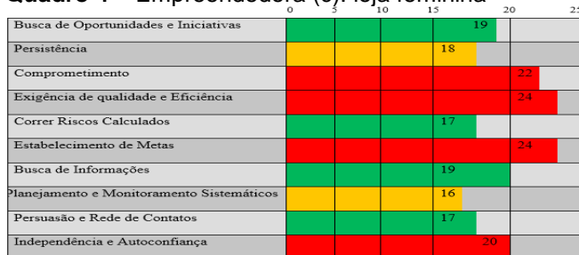
Quadro 4 – Empreendedora (c): loja feminina