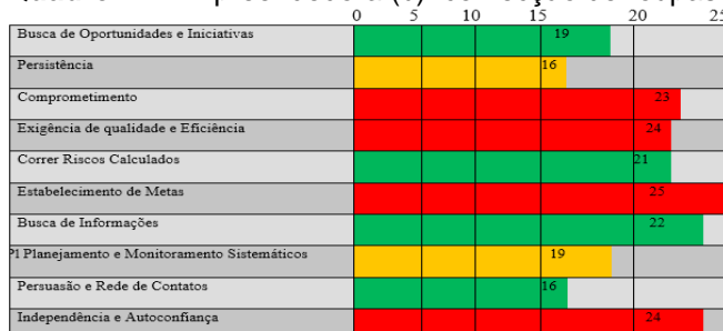
Quadro 2 – Empreendedora (b): confecção de roupas

As CCE'S listadas de vermelhos são as que tiveram índices mais altos. As CCE'S listadas de verde são as que tiveram índices intermediários. As CCE'S listadas de amarelo são as que tiveram índices mais baixos nos quadros 1, 2 e 3.