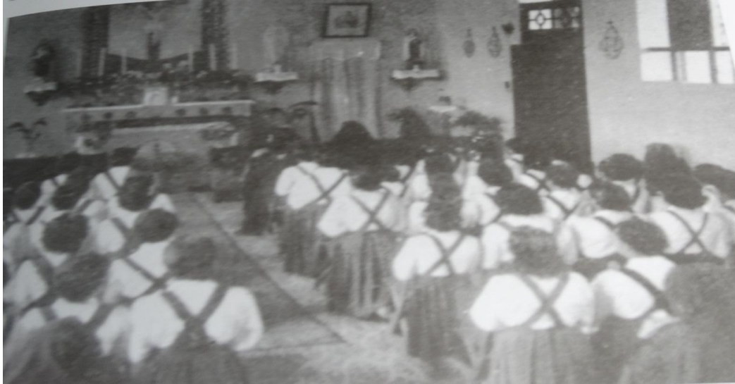
Figura 02 – Alunas da escola normal na capela do Instituto Santa Teresinha, em Bragança-Pará

comprar móveis, utensílios e materiais para o funcionamento da Escola Normal de Bragança, visando atender uma vasta clientela da região.