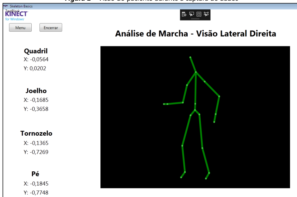
Figura 2 – Visão do paciente durante a captura de dados

A análise da marcha com o uso do software permitiu a obtenção e armazenamento dos dados dos indivíduos, conforme apresentado nas figuras 2 e 3.